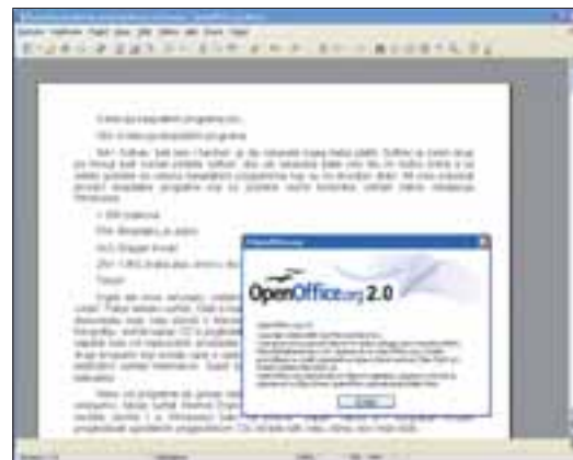
OpenOffice.org 2.0 je najbolji besplatni uredski paket

ne zanima, no možda i vi možete smanjiti troškove koristeći besplatne programe. Svi drugi će mu se vjerojatno razveseliti. Možda niste ni znali koliko ima besplatnih programa koji mogu u potpunosti zamijeniti komercijalne konkurente (Faststoneov Image Viewer, OpenOffice.org, Paint.NET samo su neki od njih). Preporučamo da iskoristite ono što vam se nudi i prestanete plaćati (ili krasti) ono što vam zapravo i ne treba. Možda će vam baš neki od ovdje dostupnih besplatnih programa olakšati život i uštedjeti nešto novca. Sve ovdje spomenute programe možete pronaći na Enterovom DVD u kategoriji "Novi programi".