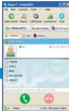
Skype je najbolji program za telefoniranje preko Interneta

Ponekad se računalo kupi samo radi surfanja Internetom te razmjene poruka e-mailom . I sami Windowsi sadrže programe kojima se to može raditi, no mi ipak preporučamo malo "pojačati" alate s kojima radite. Možda će vam osim surfanja (Avant Browser, Firefox, Opera) i čitanja e-maila (Thunderbird) dobro doći i kontrola ADSL prometa, program za telefoniranje preko Interneta ili IM program za brzu razmjenu poruka? Sve imate u ovoj kategoriji.