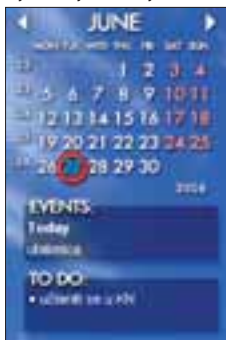
Rainlendar je prekrasan kalendar koji se dobro uklapa u svaki desktop

Najvažniji program u svakoj radnoj okolini je takozvani paket uredskih programa. On je valjda u 95% slučajeva Microsoftov Office. Na prvom mjestu od besplatnih alternativa je OpenOffice.org koji je u verziji 2.0 zaista moćan, dolazi na hrvatskom jeziku, ali je malo i mušičav (primjerice, kod napredne instalacije). Također bismo izdvojili i sjajan kalendar - Rainlendar.